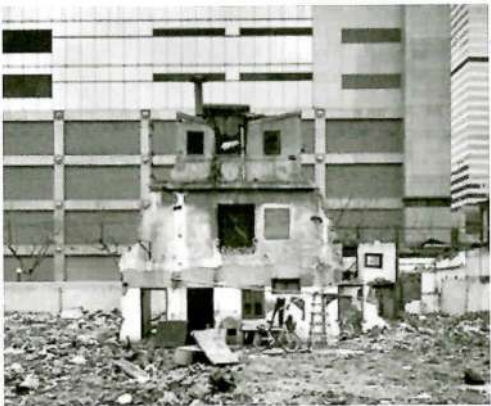
Figura 4. Urban Renewal #11 . (Burtynsky, 2004, http://www.edwardburtynsky.com ).

hacia la arquitectura comunicativa de Robert Venturi; o bien, lo que lograron inspirar las primeras muestras del arte conceptual en la obra de Peter Eisenman y John Hejduk y, más recientemente, el trabajo de Bernard Tschumi y Rem Koolhaas se contagia en muchos aspectos de la cinematografía u otras disciplinas.